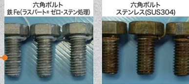
試験100サイクル経過写真