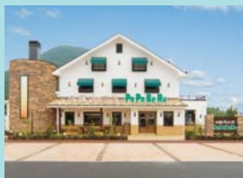
石窯パン工房 PaPaBeRu 丸亀店 様 香川県丸亀市飯野町東二中代甲261-1