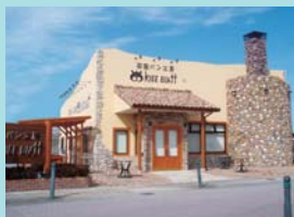
石窯パン工房 クリーブラッツ 若草店 様 福岡県大野城市若草3-5-13