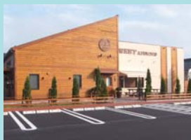
スイーツあづみ野店 様 長野県安曇野市穂高843-1