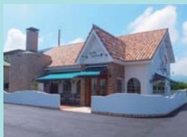
スペイン石窯工房 パンメゾン松前店 様 愛媛県伊予郡松前町大字中川原字新田406-1