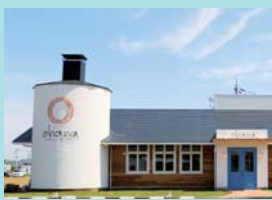
ベーカリーズキッチンオハナ 様 埼玉県本庄市早稲田の杜4-2-30