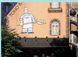
トーホーベーカリー 様 東京都三鷹市下連雀1-9-19