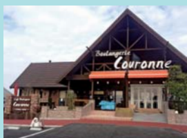
Cafe Boulangerie Couronne CHIBA-NEW 様 千葉県印西市牧の原2-1 (ジョイフル本田千葉ニュータウン店敷地内)