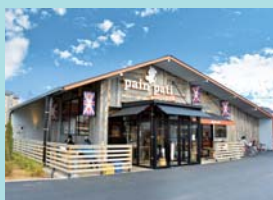
パンパーティ アンソロジー 様 東京都立川市栄町5-62-1