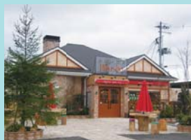
石窯パン工房 パンセ 福室店 様 宮城県仙台市宮城野区中野1-4-10