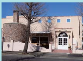
もあ石窯館 様 神奈川県横浜市青葉区藤が丘2-13-4