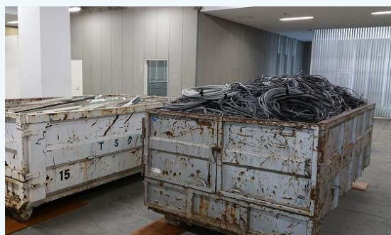
▲工事発生材買取 工事から発生する有価物も買取します