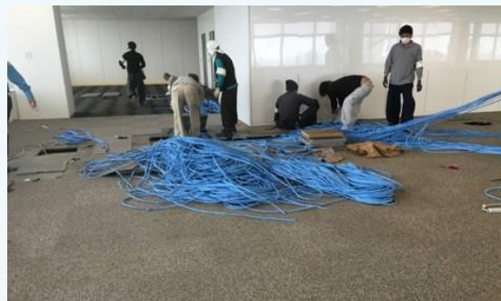
▲LAN撤去作業 B工からC工へ切り分けします