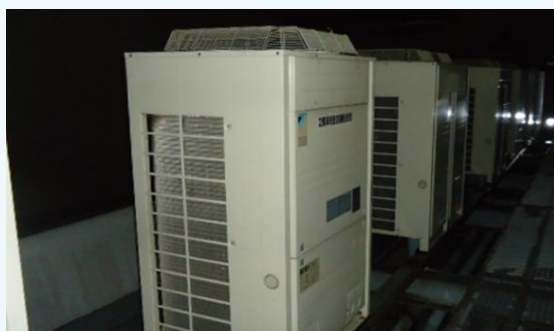
▲空調設備撤去 テナント企業が増設した空調・電気設備類を買取します