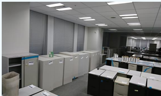
▲什器撤去 不要な什器・家具他動産物を買取します

原状回復工事見積精査、適正価格への交渉、B工からC工へ切り分け提案、オフィス什器の適正売却、工事発生材の有価物査定買取など実施致しました。