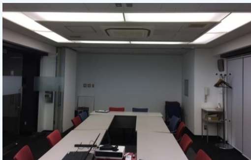
▲会議室 リニューアル前