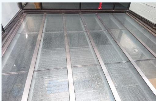
▲外壁営繕 エントランスガラス天井 清掃前

不要な什器類や、工事から発生する鉄屑などを有価売却することで廃棄物(費用)の削減が可能となり、当初予算の約半額で施工が実現できました。