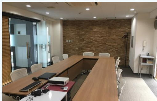
▲会議室 リニューアル後