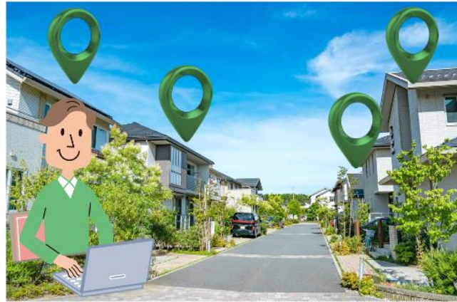
現在:日中住宅街(居住地)で位置情報を取得