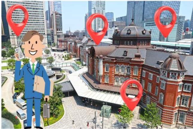
以前:日中オフィス街で位置情報を取得

勤務地エリア または 居住地エリア × ユーザー属性セグメントでターゲットを選定