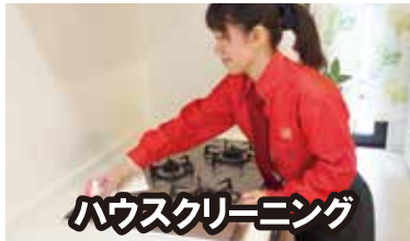
ハウスクリーニング