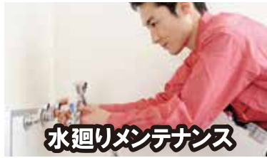
水廻りメンテナンス