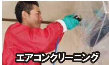
エアコンクリーニング