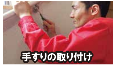
手すりの取り付け