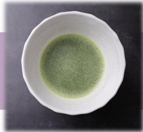
抹茶・煎茶・ほうじ茶