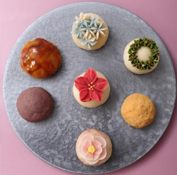
12月クリスマスのおはぎ ポインセチアやリースなど 洋風デザインを取り入れたおはぎ