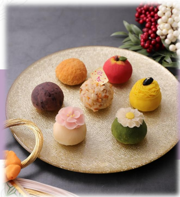
1月迎春おはぎ 黒豆きんとんなど 年始用の華やかなおはぎ