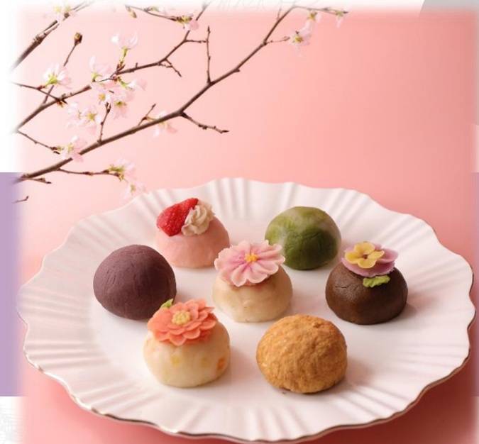
4月春のおはぎ さくらや苺など 春の訪れを感じられるおはぎ

旬の食材や季節のお花をおはぎで表現した、新感覚の和スイーツ。 まるで宝石箱のようなおはぎを、月替わりでお愉しみいただけます。