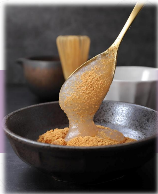
とろける本わらび餅