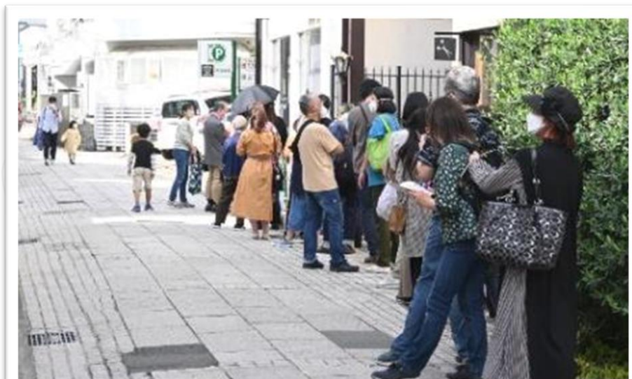
岡本オープン時 1000個完売！