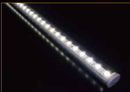
■ハイバージョンシリーズ