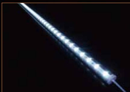
■スタンダードシリーズ