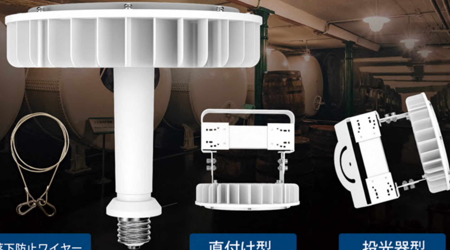
落下防止ワイヤー