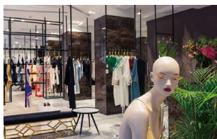
アパレル・ジュエリーショップ