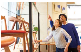
インテリアショップ