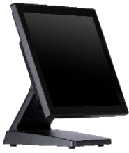
15" スタンダード/ファンレス NT-POS120