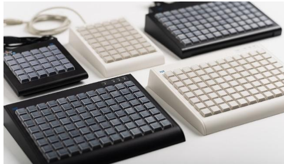
30 キー / 48 キー / 84 キー / 96 キー