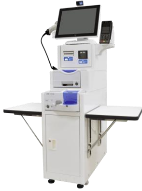
セルフレジ POS NT-POS120W フロア式