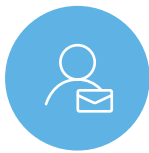
One to One コンテンツ