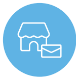
店舗別 コンテンツ配信