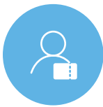
One to One クーポン