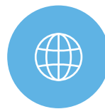
アプリ内ブラウザ