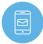
アプリ内メッセージ