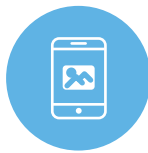
フローティング 広告