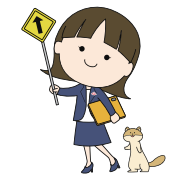
「みちてん」キャラクター みっちゃん&テンちゃん