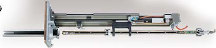
Tube Lens Camera