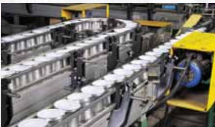
製造現場のモニタリング