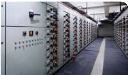
重要機器の継続的モニタリング

AX8は赤外線カメラと可視光デジタルカメラを搭載しながら、54×25×95mmのコンパクト設計で、スペースが限られた場所でも簡単に設置でき、重要電気機器や機械設備などを稼働したままで継続的に温度をモニタリングします。