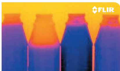
不透明ボトルの液量を検出

複数台のカメラが必要な場合や立体画像を撮影する場合、1台をマスター、他をスレーブに設定して同期することが可能です。